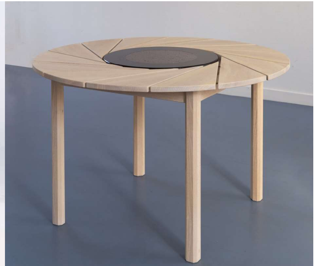
table de terrasse en acacia avec un plateau tournant en pierre de lave émaillée* 2018 *Collaboration avec studio LeR