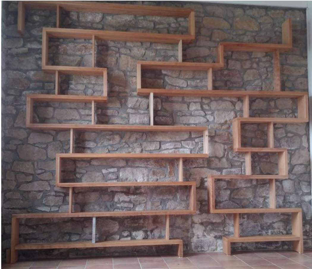
ULTIMA bibliothèque en orme 2016